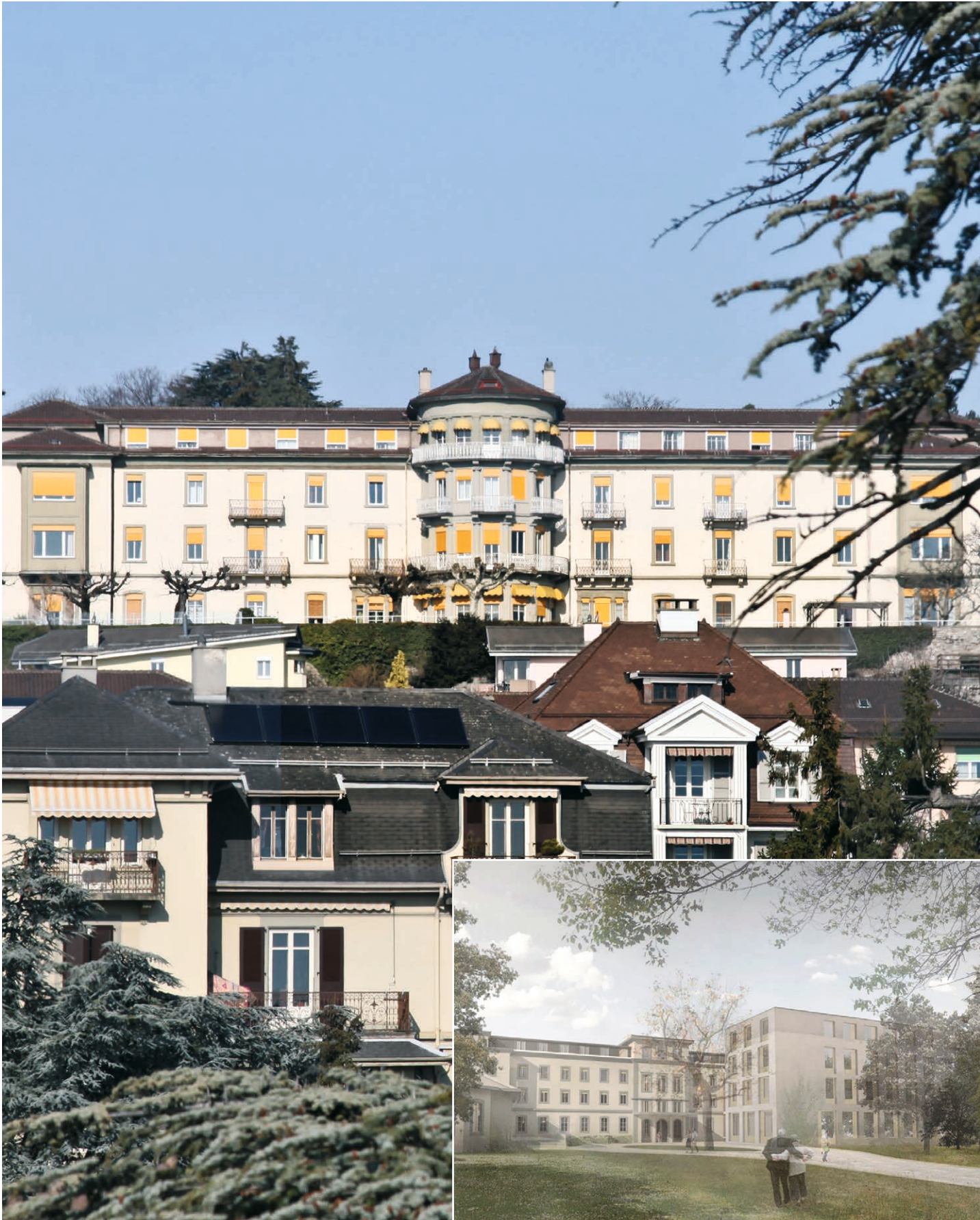
À Vevey, une bâtisse centenaire s'offre une nouvelle jeunesse : Les Berges du Léman .