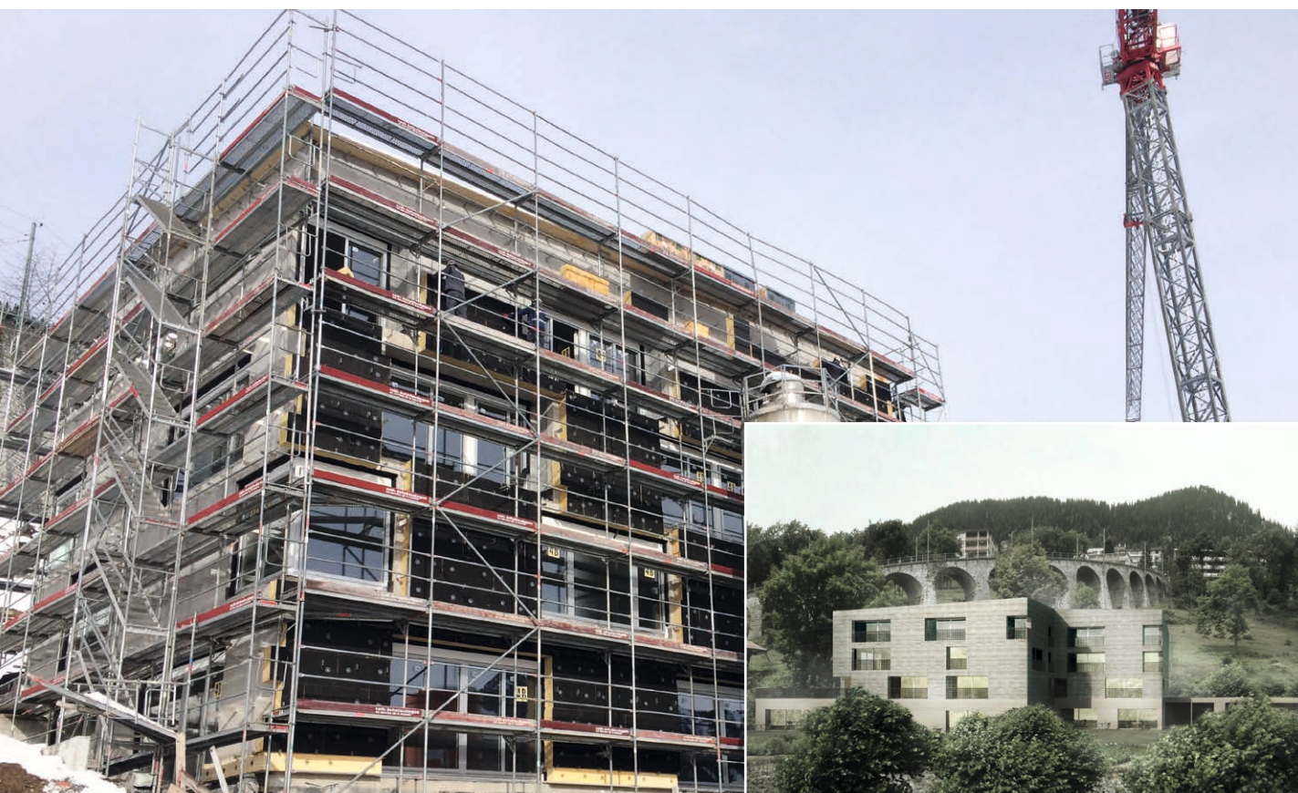
Le Chalet de l'Entraide cèdera bientôt la place au Foyer de l'Entraide sur la commune de Leysin.