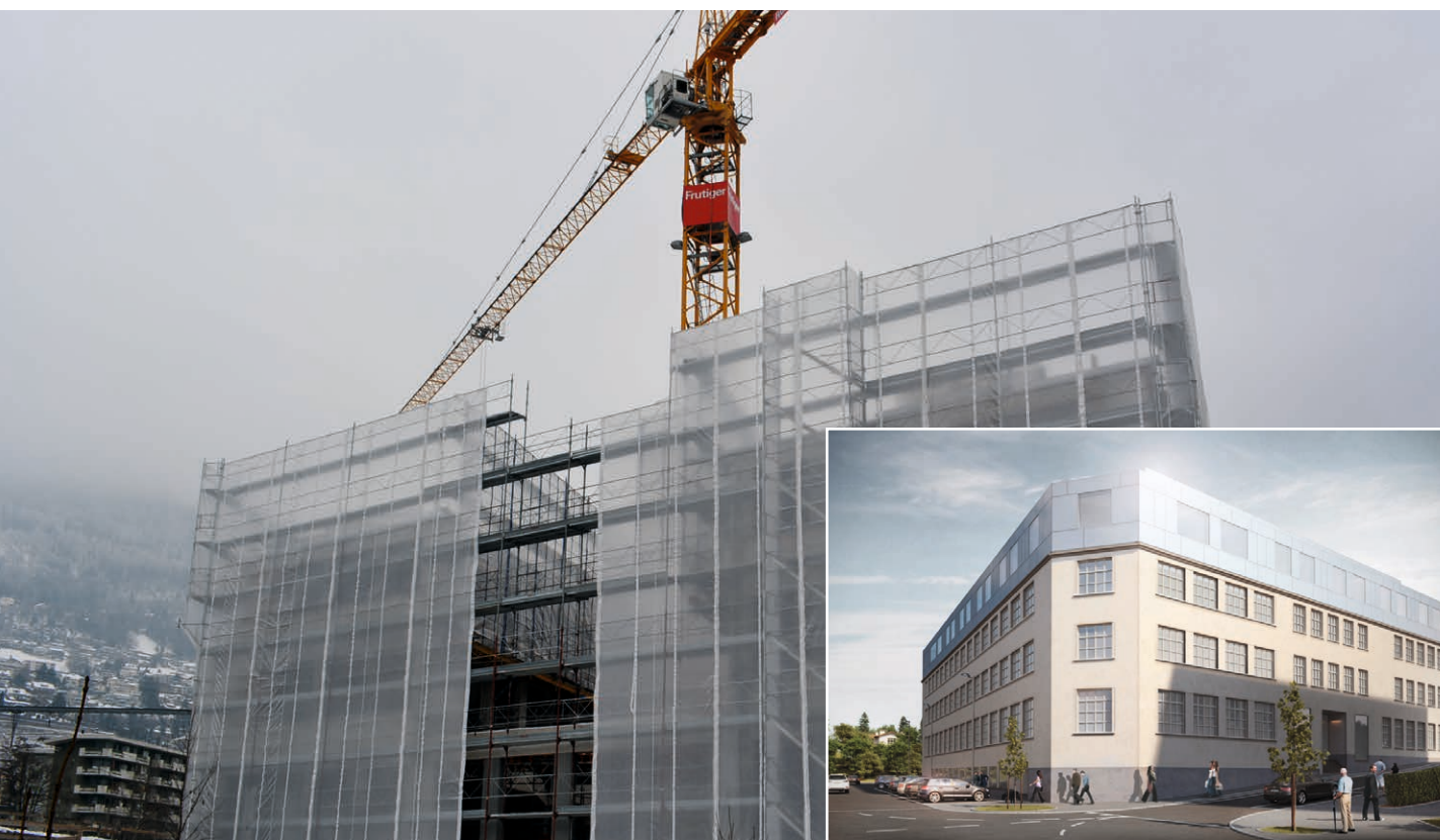
Le centre de prestations à la personne âgée Les Hirondelles verra le jour au printemps 2018.