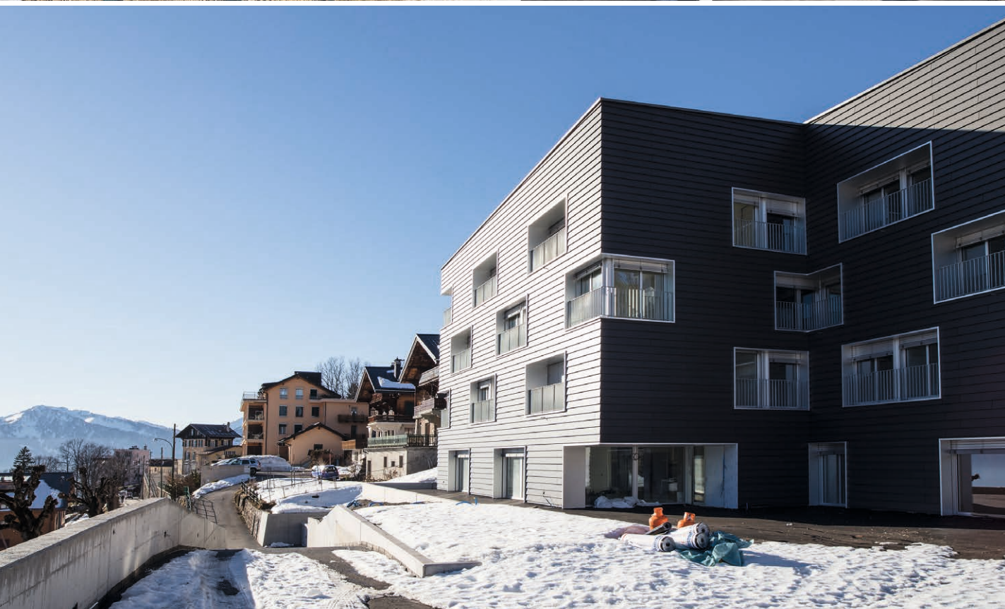
Pile et face: l' ODMER se tient prêt pour l'inauguration... et à accueillir de nouveaux résidents.