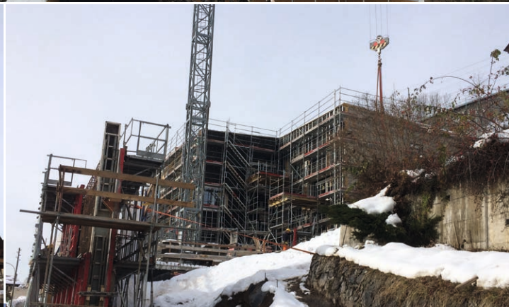
... et qui petit à petit a donné vie à l'ODMER.