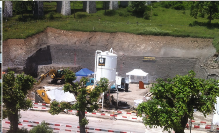
Un chantier gigantesque, parti de rien...