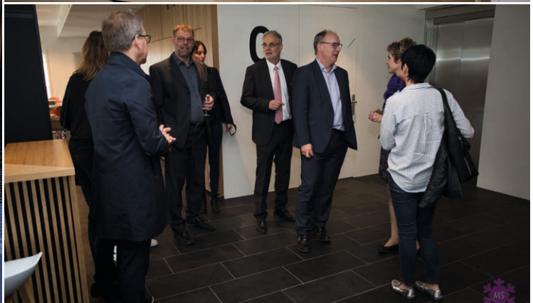
L'inauguration a été suivie par une visite des lieux – côté cour et côté jardin.